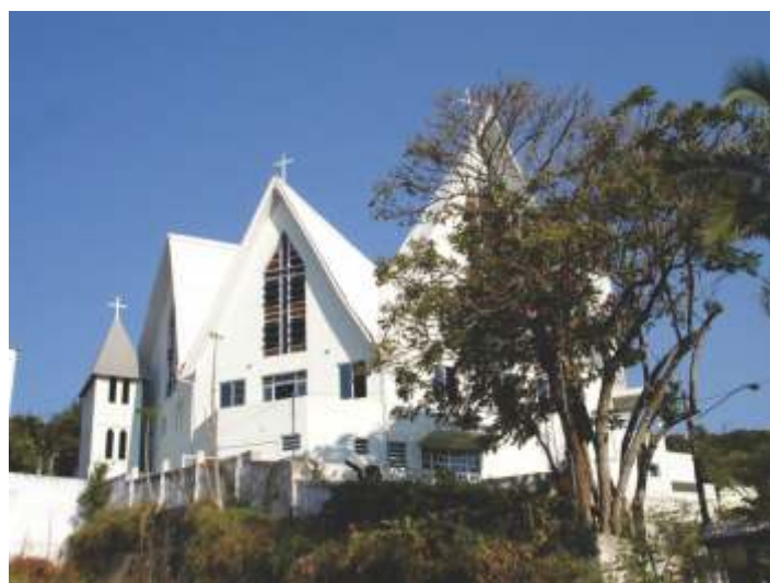
Carmelo de Cabeçadas Fundado em 01 de janeiro de 1986.

"Bendito seja Deus, pois sou filha da Igreja." Essas palavras de Santa Tereza nos recorda que não podemos viver o Evangelho conforme os nossos critérios, mas segundo a fé da Igreja: "Crede firmemente no que crê a Santa Mãe Igreja e estai seguros de irdes por bom caminho".