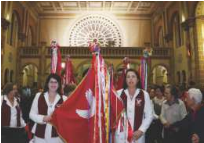
Entrada das Bandeireiras na Celebração