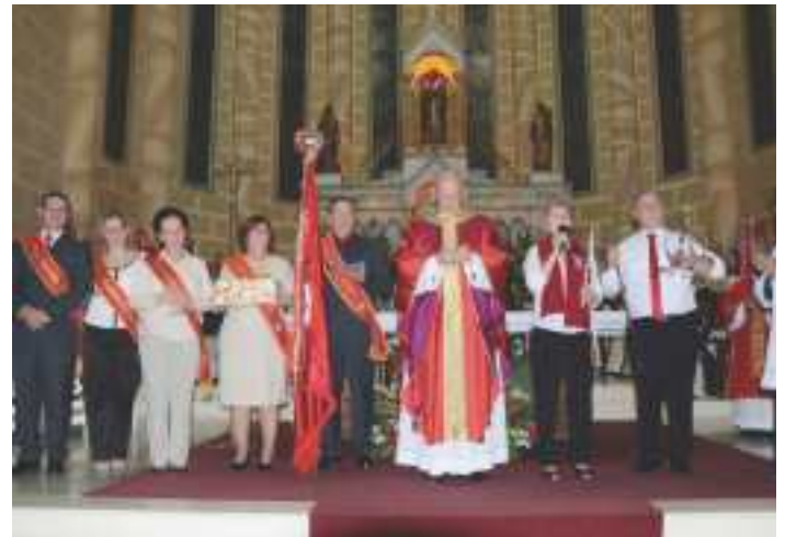
Casais Imperadores de 2012, 2013 e 2014