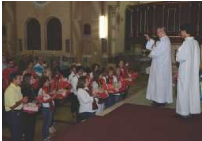
Benção dos Pães