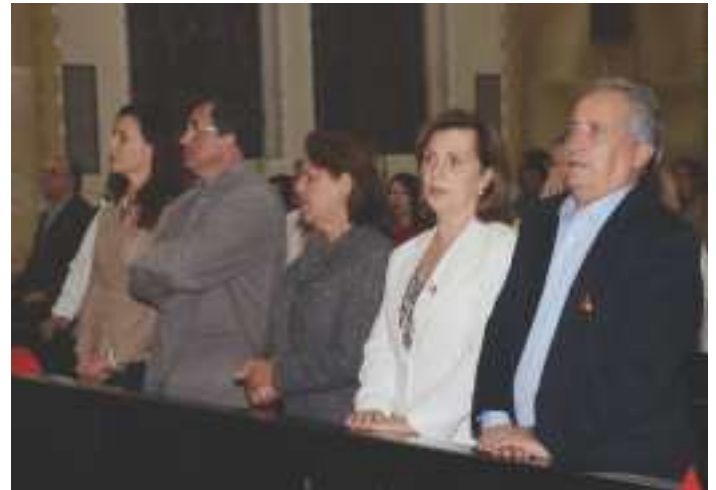
Padrinhos na Celebração