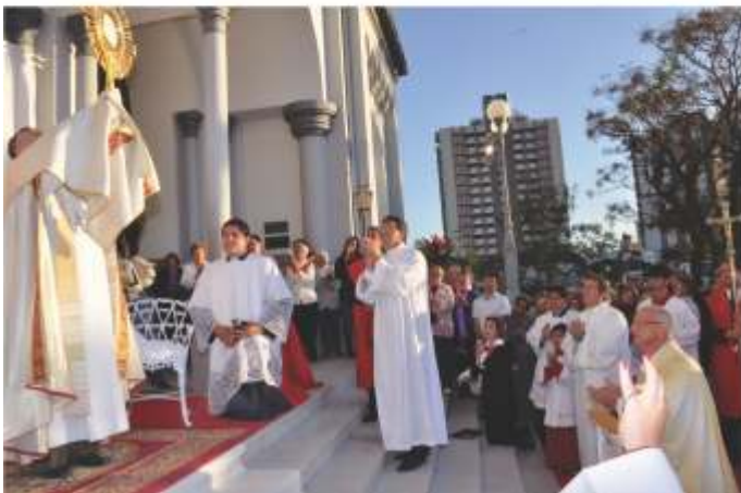
Bênção com Santíssimo