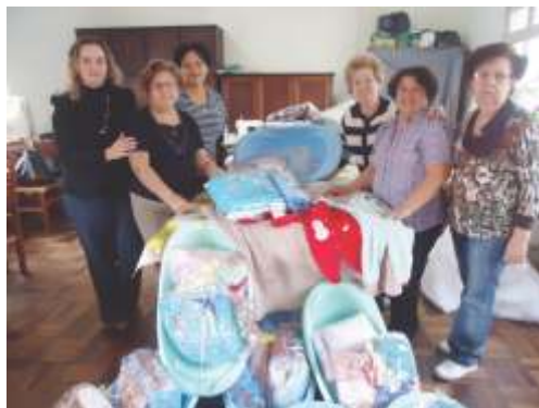
Entrega de enxovais para Oficina de Costura.