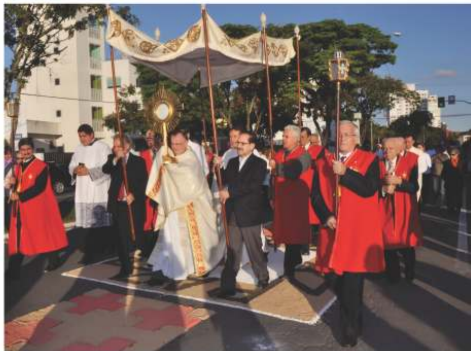
Procissão pelas ruas