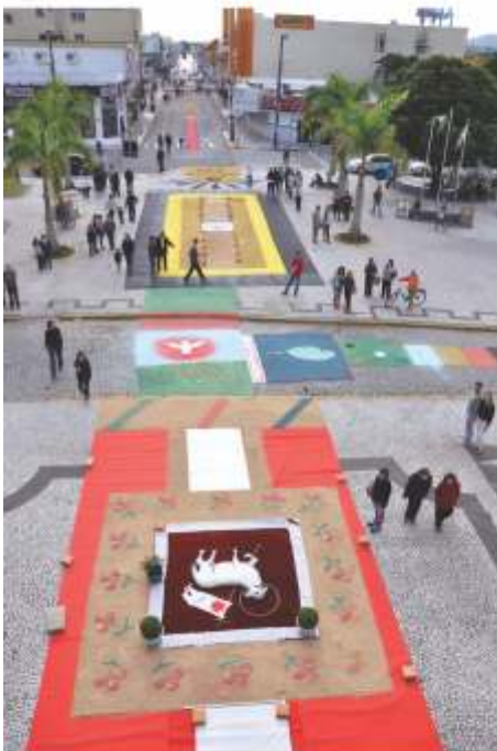
Confeção dos Tapetes