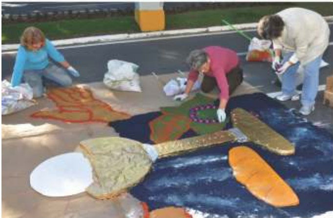
Confeção dos Tapetes