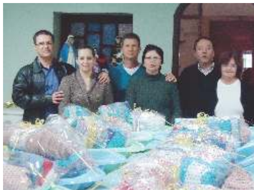
Pastoral do Dízimo organizando os enxovais.