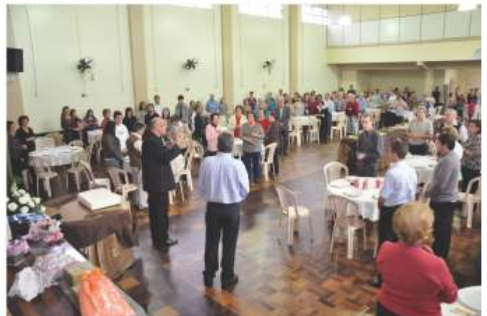
Confraternização no Salão Paroquial