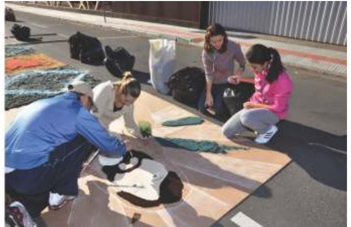
Confeção dos Tapetes