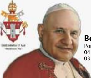
Beato João XXIII Pontificado 04 de novembro de 1958 03 de junho de 1963

Canonização Papal Peregrinação a Roma e Santuário de Fátima Data: 27 de abril de 2014