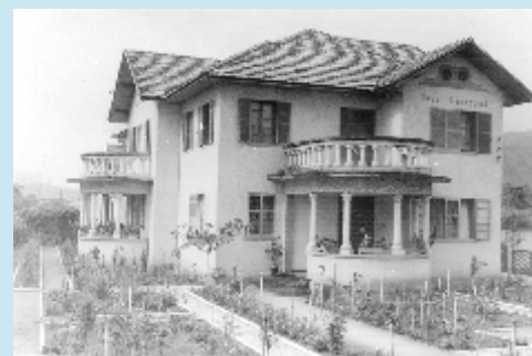
(Antiga casa paroquial – 1956)

Como mensagem ela nos deixa: O Sacrifício, abnegação, ordem, disciplina, religião, instrumentos indispensáveis a nossa vida do Bem e de Deus.