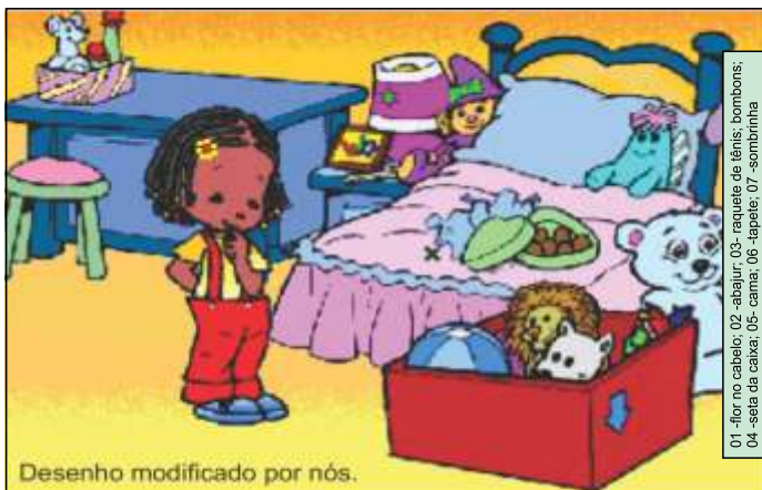
Desenho modificado por nós.

01 - flor no cabelo; 02 - abajur; 03 - raquete de tênis; bombons; 04 - seta da caixa; 05 - cama; 06 - tapete; 07 - sombrinha