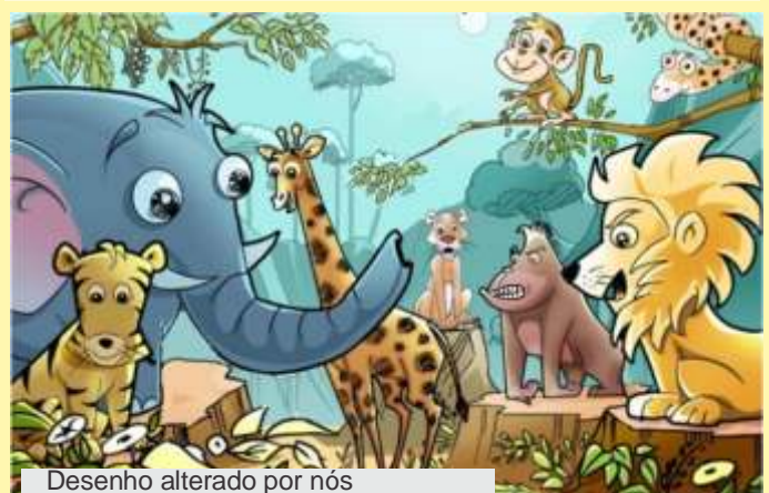
Desenho alterado por nós

Resposta: 01-Girafa, 02-pássaro, 03-folhas ao lado da girafa, 04-rabo do macaco, 05 boca do macaco, 06-perna do elefante, 07-olhos da onça.